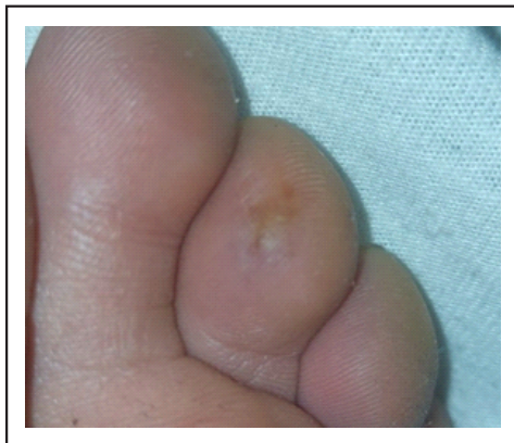
Figura 2. Se observa lesión macular eritematoviolácea en pulpejo del tercer dedo pie izquierdo.